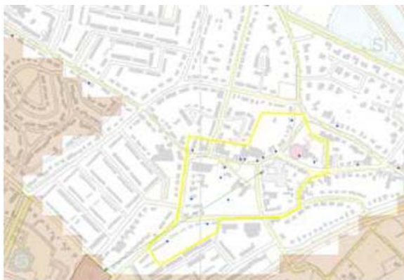
Op de Cultuurhistorische Waardenkaart is de stedenbouwkundige structuur van Beek een redelijk hoge waarde toegekend

Ook de oude dorpskern met het driehoekig plein is cultuurhistorisch van waarde. De structuur dateert grotendeels uit de Late Middeleeuwen (1250-1500), toen de oudtijds verspreide bewoning zich verplaatste naar de randen van de akkercomplexen en oude alleengeleggen hoeven of 'einzelhöfe' werden opgesplitst en uitgroeiden tot buurtschappen. De huidige kern van Beek is ontstaan uit het buurtschap Heuvel. Het centrum van Beek, met de kerk, lag in de Middeleeuwen rond de nog steeds bestaande middeleeuwse kerktoren, die enkele eeuwen eenzaam in de akkers heeft gelegen. Reeds in het begin van de 18e eeuw was het buurtschap Heuvel uitgroeid tot het nieuwe centrum van Beek, waar ook het raadhuis was gevestigd. Het bebouwingsbeeld, met overwegend eenlaags bebouwing, dateert met name uit de periode 1850-1950. Monumentale gebouwen zijn ondermeer de R.K. kerk van de H. Michael (1933-1935), het voormalige raadhuis (1866-1867) en het klooster Gesticht St. Joseph (1895).