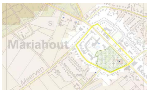
Op de Cultuurhistorische Waardenkaart is de stedenbouwkundige structuur van Mariahout een redelijk hoge waarde toegekend

Kenmerkend voor de stedenbouwkundige structuur van het dorp zijn de centrale ligging van het processiepark en de kaarsrechte wegen. De kom wordt doorsneden door de rechte Mariaweg en ligt ingeklemd tussen hoekig gebogen wegen. 1 Kenmerkend is het processiepark met daarin gelegen de R.K. kerk van O.L. Vrouw van Lourdes (1933), pastorie, klooster met school (1949, 1953), Lourdesgrot (1935, recentelijk vernieuwd) en openluchttheater (1946). Nabij het processiepark staat het café de Pelgrim (1933).