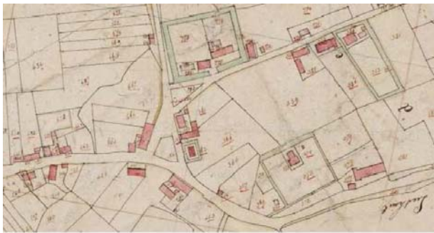
Lieshout -de Heuvel en omgeving omstreeks 1832

De stedenbouwkundige structuur van de kern Lieshout wordt gekenmerkt door de aanwezigheid van een driehoekig plein die ligt op de plek waar enkele historische dorpslinten samenkomen. De structuur dateert grotendeels uit de Late Middeleeuwen (1250-1500), toen de oudtijds verspreide bewoning zich verplaatste naar de randen van de akkercomplexen en oude alleengeleggen hoeven of 'einzelhöfe' werden opgesplitst en uitgroeiden tot buurtschappen. Het bebouwingsbeeld van Lieshout bestaat overwegend uit eenlaags bebouwing dateert die met name dateert uit de periode 1850-1950. Onder deze bebouwing bevinden zich veel (verbouwde) langgevelboerderijen.