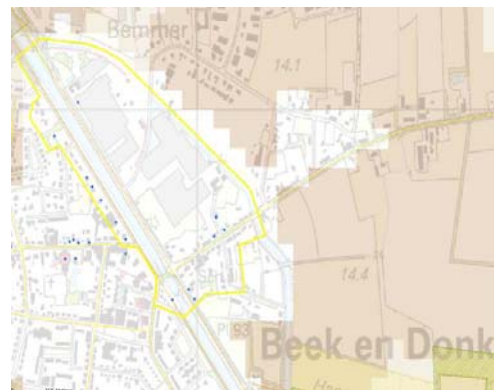
Op de Cultuurhistorische Waardenkaart is de stedenbouwkundige structuur van Donk een redelijk hogere waarde toegekend