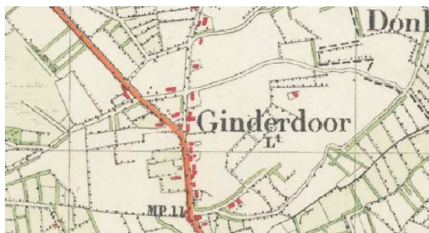
Het dorp Ginderdoor omstreeks 1927