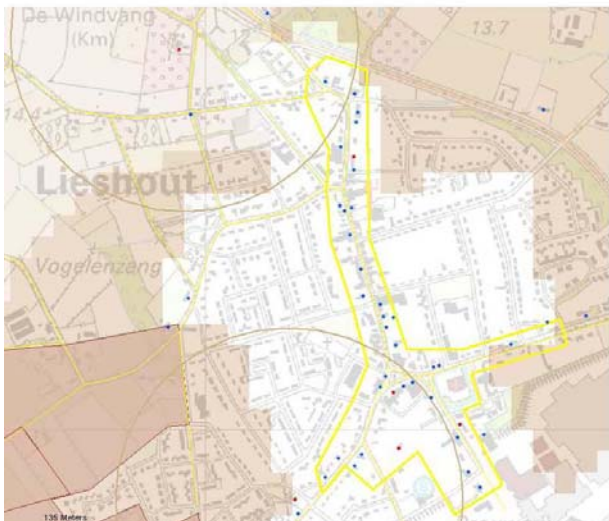
Op de Cultuurhistorische Waardenkaart is de stedenbouwkundige structuur van Lieshout een redelijk hoge waarde toegekend