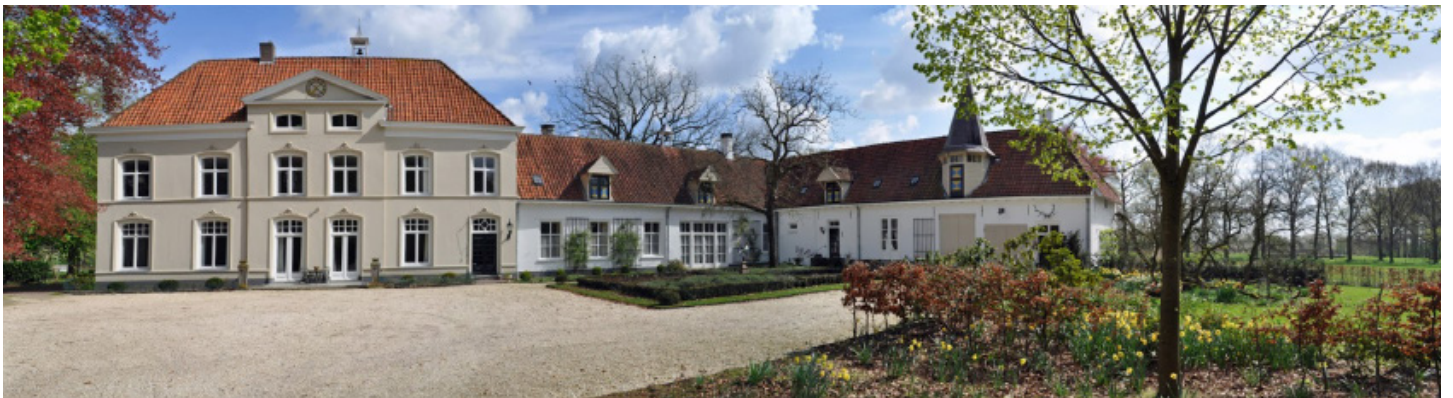
Binnenplaats van Eyckenlust met rechts zicht op de Kasteelsingel aan de Aa.

Strootman Landschapsarchitecten en Floris Alkemade maken in opdracht van het landgoed en de gemeente een masterplan voor een duurzame en toekomstgerichte ontwikkeling van het landgoed. De gebiedsvisie is hiervoor de basis. De gemeente, waterschap Aa en Maas, provincie Noord-Brabant en de Rijksdienst voor Cultureel Erfgoed zijn intensief betrokken bij dit proces.