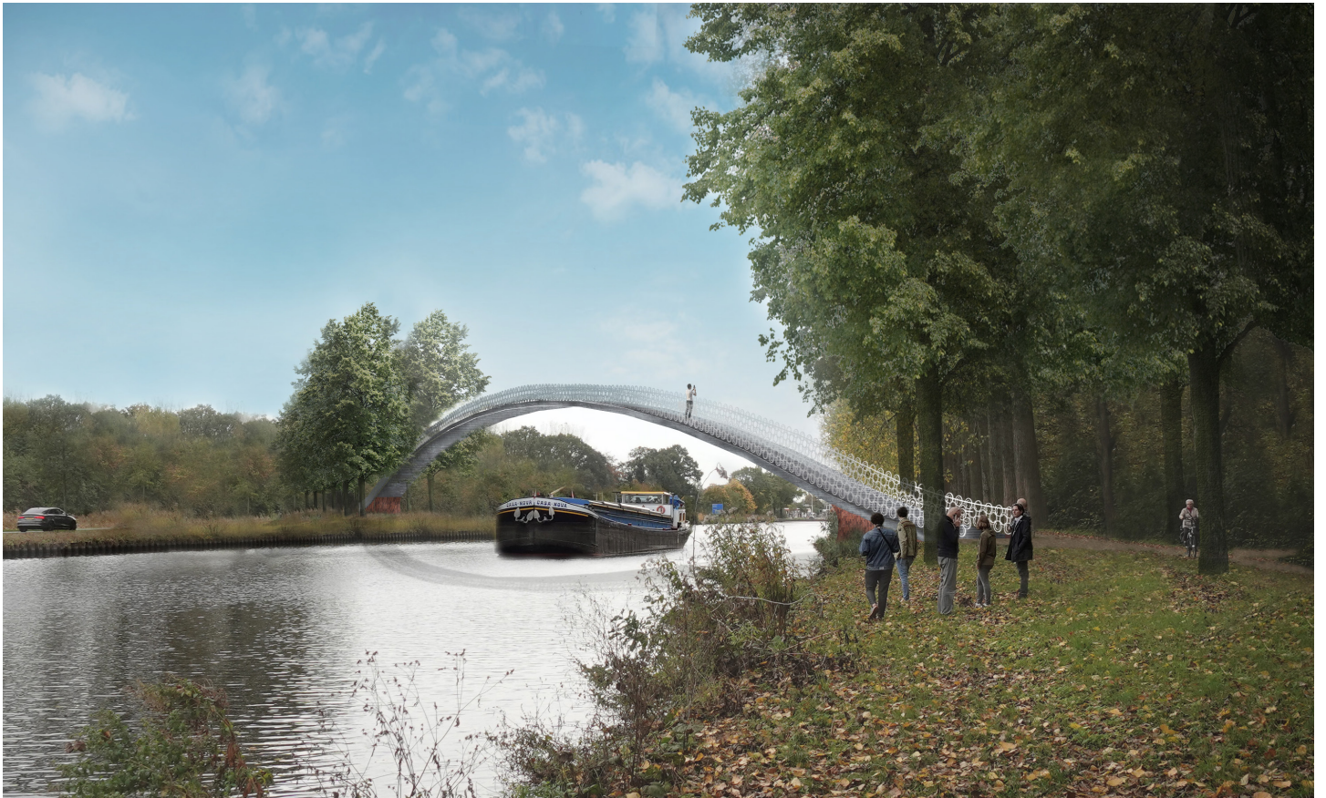
Impressie mogelijke brug over de Zuid-Willemsvaart.